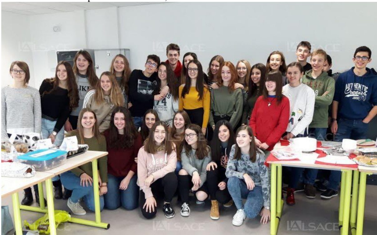
La classe de 1 re section européenne anglais qui s'apprête à rejoindre les USA.

Le 28/10/2018 04:01 par Nicolas LEHR , actualisé le 27/10/2018 à 19:39 Vu 68 fois